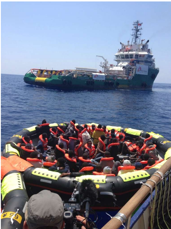
Intervention de Sea Watch avec des îles du sauvetage, en retrait il y a le bateau Bourbon Argos de Medicine Sans Frontieres.